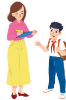
Unit 1 - My New School 9